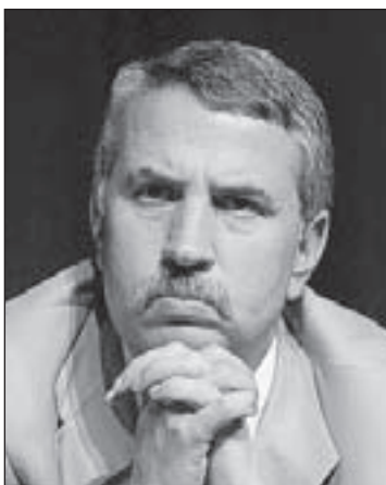
THOMAS L. FRIEDMAN © 2012 New York Times